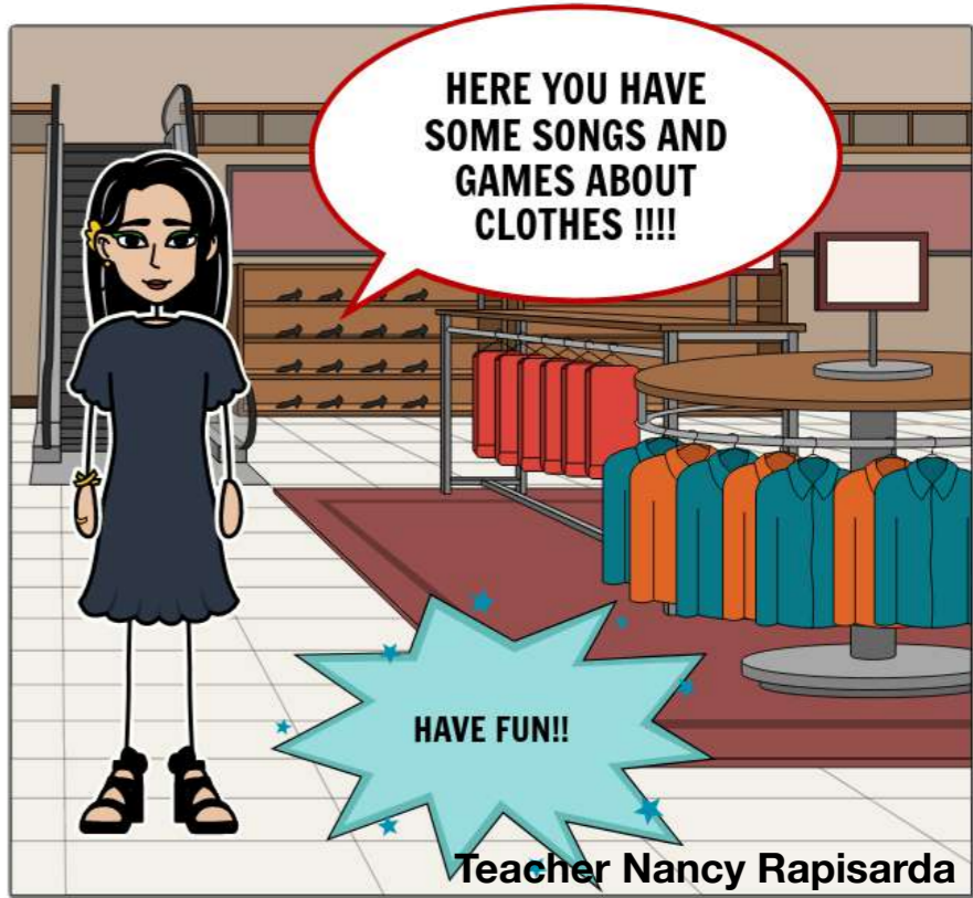
Crea il tuo a Storyboard That